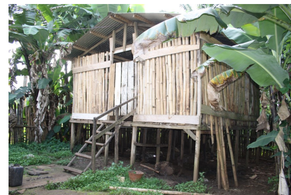
Porcherie sur Pilotis en matériaux locaux