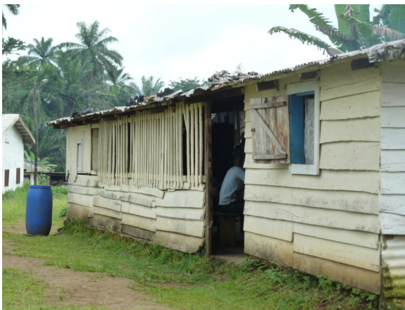
Locaux de Fareso au village de Ntolo